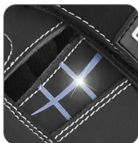
reflexní pásy reflective straps paski odblaskowe