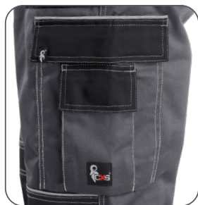
multifunkční kapsy multifunctional pockets kieszenie wielofunkcyjne